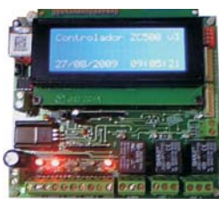
CONTROL DE ACCESO